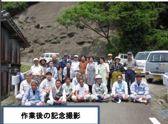
作業後の記念撮影