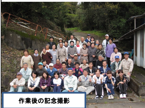
作業後の記念撮影