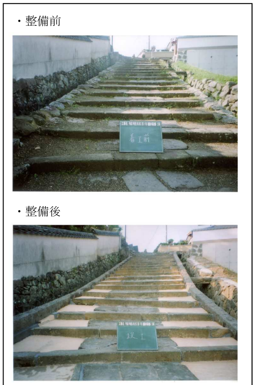
○観光交流センター整備後