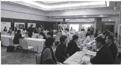
【第2部】 企業とNPOのマッチング面談会

NPO・企業・行政など多様な主体が新たに協働関係を築く契機とするため、11月13日(木)に「地域協働ひろば in 佐伯」を開催しました。