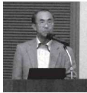
【第1部】 藤原氏の講演